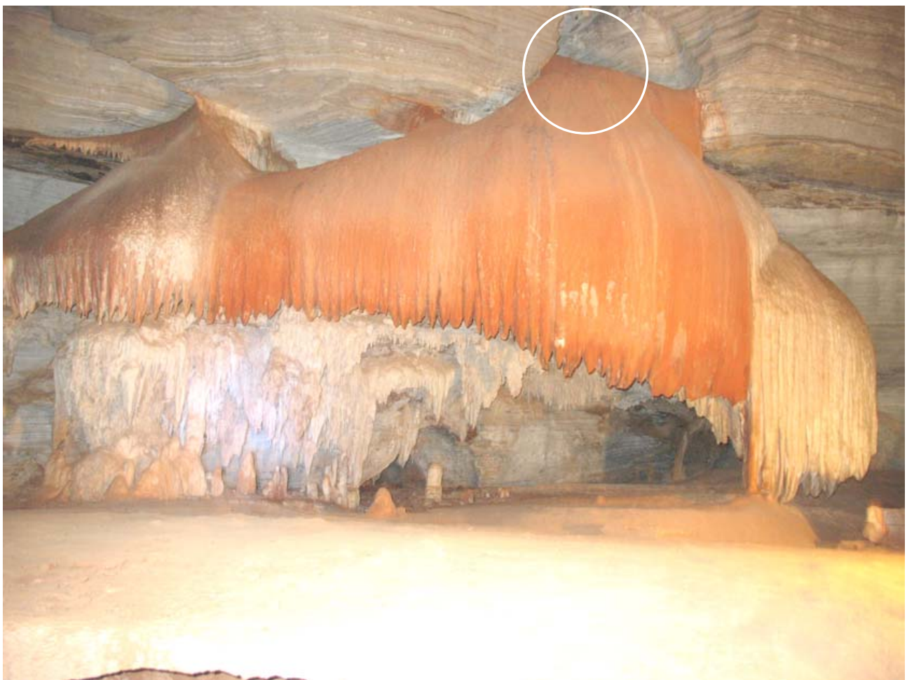
Figura 4: Contaminação do espeleotema por argila superficial (detalhe do local de infiltração);

Estudos sobre os diversos impactos ambientais nas cavernas de Iraquara ainda são muito incipientes. Para tanto, torna-se necessário a elaboração de diversas pesquisas nessa área. Os resultados poderão contribuir, sobretudo, para uma melhor utilização destas cavidades, e para a elaboração do plano de manejo espeleológico.