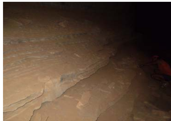
Figuras 2 e 3: Grande concentração de sedimentos no solo da Caverna (2); Acúmulo de sedimentos nas paredes da Caverna Lapa Doce I (3); Fotos: Rodrigo A. Santos.