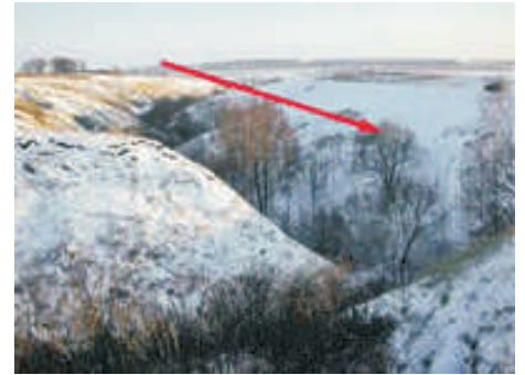
Localização da caverna.

Em outubro de 2007, cerca de 30 integrantes de uma seita russa se esconderam em uma caverna em uma colina na região de Penza, na região central da Rússia, para esperar pelo juízo final. O grupo era formado por 29 adultos e quatro crianças. Segundo a imprensa russa, eles teriam levado comida e combustível para o local e teriam ameaçado cometer suicídio explodindo um tanque de gás se a polícia interferisse. O líder da seita, Pyotr Kuznetsov, 43 anos, que não se juntou ao grupo, foi preso e está sendo acusado formalmente pelos promotores locais. O grupo afirmava que o mundo iria acabar em maio deste ano.