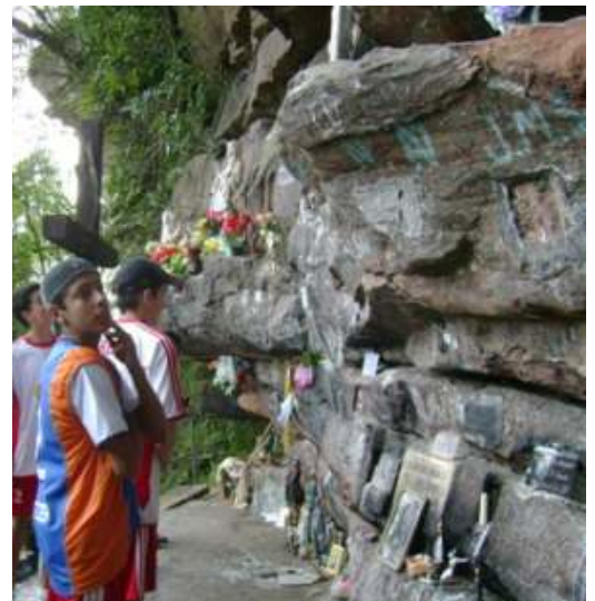
Gruta do Monge, na cidade de Lapa-PR

Sua principal atração é a Gruta do Monge que motiva grande número de fiéis e visitantes movidos pelos fenômenos extraordinários evidenciados pelo poder da fé. A gruta teria sido abrigo do ermitão João Maria D'Agostinis, que se dedicou ao estudo das plantas da região, fazendo orações públicas e medicando enfermos. Possuía olhar manso, estrutura baixa, rosto magro, vestia hábito franciscano sobre o qual caíam longos cabelos, barba grisalha, e repartia com seus semelhantes o único bem que possuía - a fé. O acesso ao parque se dá por rodovia pavimentada em um percurso de 3,5 km, de onde se descortinam paisagens características do Paraná, com muitas araucárias. No topo da elevação, quase na entrada do Parque está a estátua de Cristo abençoando a cidade.