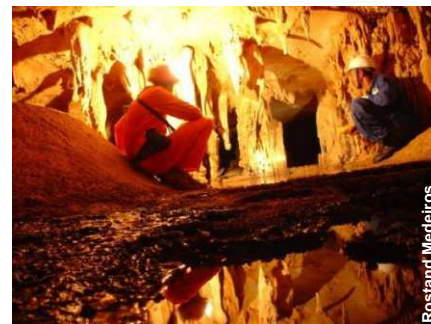
Imagens do álbum da SEPARN.

Acima: Salão Central da Gruta Isadora (jan/2005)