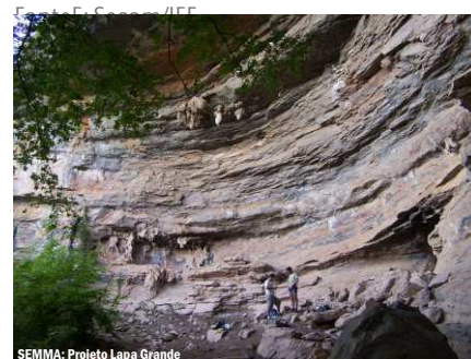
SEMMA: Projeto Lapa Grande