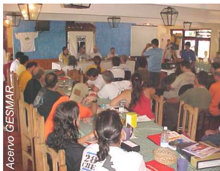
A cerimônia de abertura do XV Encontro Paulista de Espeleologia, em Eldorado (SP)

Após a cerimônia, os inscritos participaram das oficinas propostas, que contribuíram para troca de conhecimento e formação dos iniciantes em espeleologia (Introdução à Espeleofotografia, Fundamentos de Cartografia e Utilização de GPS, Tópicos de Manejo e Roteiros em Espeleoturismo, Básico de Técnicas Verticais e Noções de Geomorfologia em Áreas Cársticas) e no início da noite houve um breve histórico do PROCAD, que foi seguido de discussão entre os participantes levantando os pontos fortes e fracos das edições anteriores do projeto. Ao final da noite de sábado, os participantes fizeram uma confraternização para relembrar os velhos tempos, reencontrar amigos e conhecer os novos interessados em espeleologia. Foi um momento que ficará na memória dos presentes.