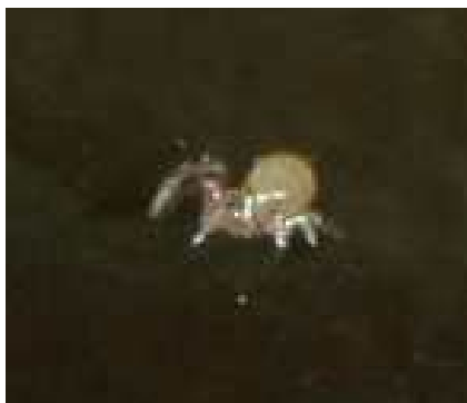
Exemplar da aranha encontrada por acaso na Gruta do Frade, com 1mm de comprimento