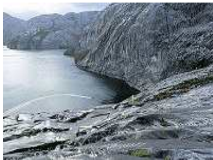
A Ilha Madre de Dios