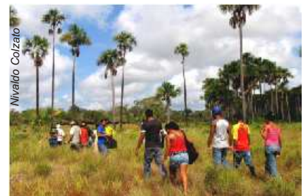
Alunos em atividade multidisciplinar

1992 no município de Mazagão (AP) e localiza-se no Assentamento Extrativista Maracá II. Possui cerca de 800 habitantes de baixa renda, cuja atividade econômica básica é o extrativismo (castanha do Brasil, andiroba, madeira). A Escola Família de Maracá possui cerca de 200 alunos de ensino básico e fundamental que precisam ser estimulados a continuarem os seus estudos, sem perder o vínculo com o lugar onde moram, como também criar alternativas de renda para suas famílias.