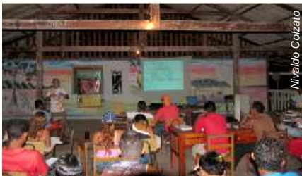
À noite, palestras e apresentações de Filmes no galpão da Escola Família

Muito há para se discutir sobre o potencial turístico, espeleológico e arqueológico do Estado do Amapá, cujos assuntos variam desde a capacitação de profissionais treinados para analisar a capacidade de turismo desta unidade federativa, os impactos sociais desta atividade na comunidade imediatamente envolvida, o controle epidemiológico e o turismo, até a elaboração de políticas públicas de fomento ao setor.