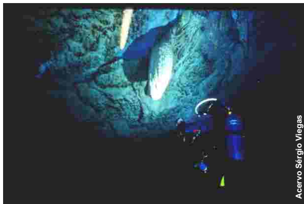
Mergulhador ilumina estalactite na Gruta do Mimoso, Bonito-MS.

Os caminhos para formação, tanto do mergulhador recreativo quanto do mergulhador de cavernas, também foram discutidos, bem como a Instrução Normativa 100, publicada em 05 de junho de 2006, que regulamenta a atividade de mergulho em cavernas no Brasil.