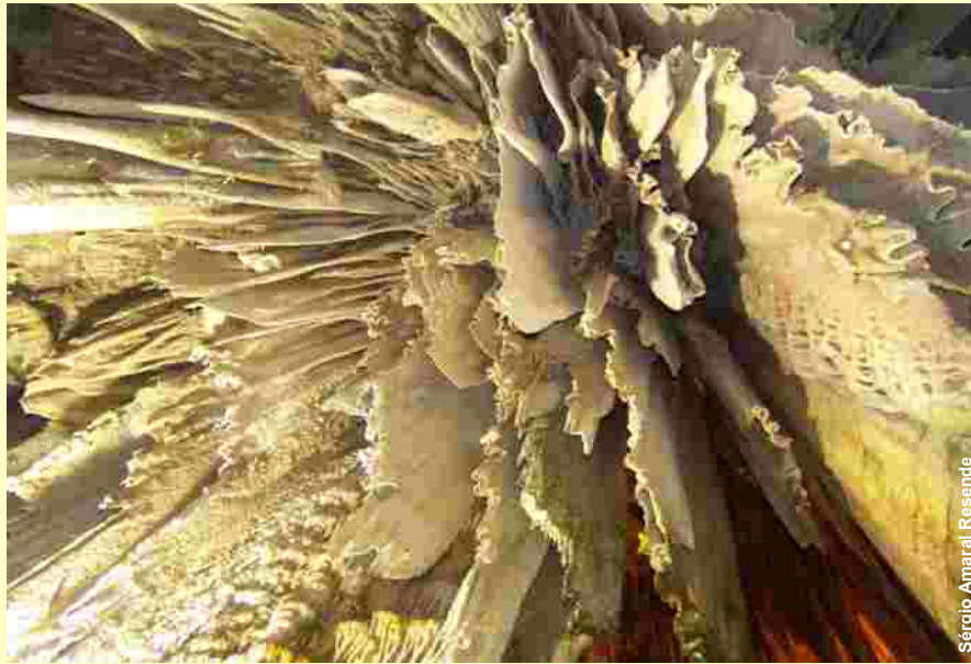
Sérgio Amaral Resende