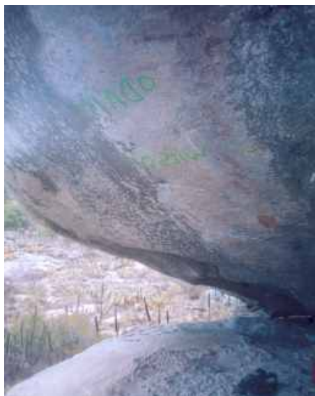
Sítio arqueológico Pedra do Letreiro, município de Caserengue PB (Pequeno abrigo sob rocha totalmente pichado com tinta sintética sobre as figuras rupesres)

ções acontecem com frequência. Mas pouco ou quase nada fora feito até o momento para estabilizar o problema.