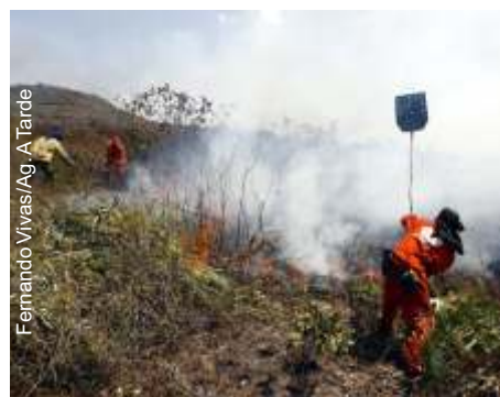
A Chapada Diamantina, castigada pelas chamas, abriga importantes cavernas.

Cerca de 350 brigadistas trabalham para tentar controlar os focos de incêndio que atingem a região da Chapada Diamantina, Bahia. De acordo com o relatório do Corpo dos Bombeiros, onze municípios sofrem com as chamas. A situação é mais grave em Andaraí, Ibicoara, Itaeté e Mucugê.