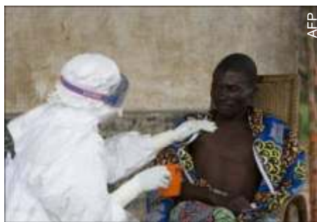
Enfermeira da ONG Médicos sem Fronteiras cuida de paciente infectado com o vírus Ebola em Kampungu, R.D. do Congo.

Cientistas canadenses fizeram uma descoberta que pode levar a uma melhor compreensão dos elementos que geram a transmissão do vírus Ebola de um animal para um humano e que pode evitar epidemias, anunciou a Agência de Saúde Pública do Canadá (ASPC).