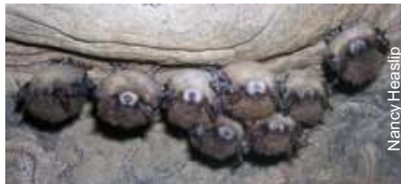
Síndrome do nariz branco mata morcegos nos EUA

morcegos marrons e outras espécies nas cavernas da região, disse Blehert. As mortes em massa são uma das piores calamidades a atingir populações de morcegos nos Estados Unidos.