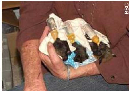
Mamadeiras e incubadoras ajudam na recuperação

Na clínica na sua casa, os filhotes encontrados desamparados ou machucados geralmente ficam por 12 meses. Os recém-nascidos ficam algumas semanas