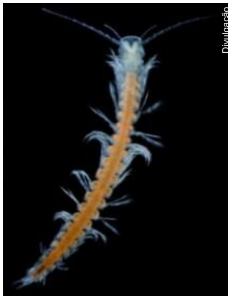
Speleonectes atlantida mede de 10 a 20 mm

Apesar de não possuir olhos, este novo habitante, com um comprimento entre 10 a 20 milímetros, está, como outros remípedes (da classe Remipedia), adaptado para a vida numa caverna sem luz, dispondo de longas antenas na parte da cabeça e de filamentos sensitivos ao longo do corpo.