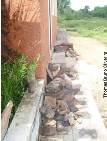
Depósito de fósseis nos fundos do museu

O Vale dos Dinossauros pode ser considerado um dos maiores sítios paleontológicos da América do Sul. Localizado na bacia sedimentar do Vale do Rio do Peixe, na mesorregião do Sertão da Paraíba, área rica em ocorrências espeleológicas e também arqueológicas, vem sofrendo a ação danosa do homem e do tempo.