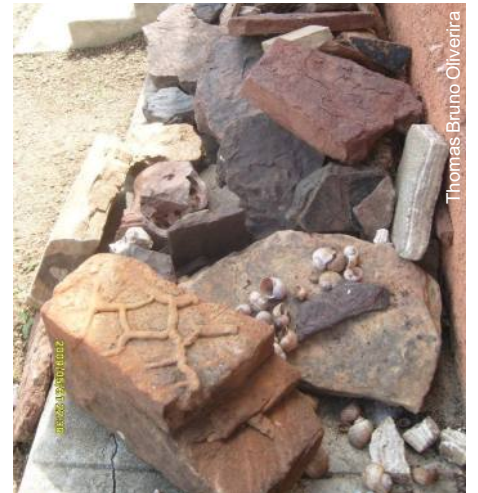
Reserva técnica - material deveria estar protegido

Apesar do estado de caos, do abandono e da falta de políticas sérias que visem à preservação do local, vale a pena visitar o Vale dos Dinossauros, fotografar o que ainda resta de suas pegadas petrificadas e contemplar o entardecer no Sertão da Paraíba.