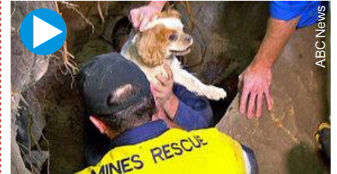
Clique na imagem para ler a matéria completa da ABC News, incluindo um vídeo (em inglês)

O cão "Scooby" foi resgatado dia 09 de setembro por uma entidade de proteção de animais após ficar cinco dias preso em uma caverna no estado da Nova Gales do Sul, na Austrália, segundo reportagem da emissora australiana "ABC News".