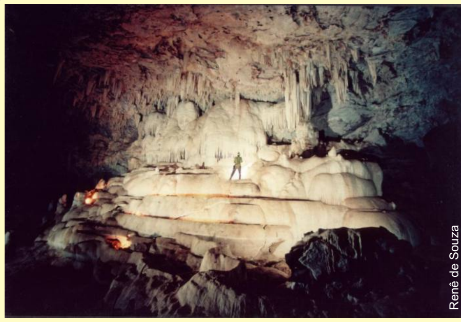
Renê de Souza