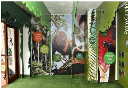
Novo Centro de Visitantes da Caverna do Diabo

A reforma também inclui o novo projeto de iluminação da Caverna do Diabo e capacitação de monitores, empresas e empreendedores para atender o potencial turístico da região.