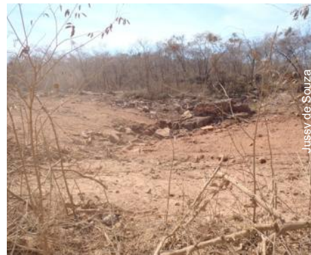
Atterrando tudo no caminho

Ibama acesso ao estudo de impacto ambiental da obra, documento público.