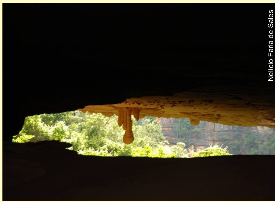
Nelício Faria de Sales