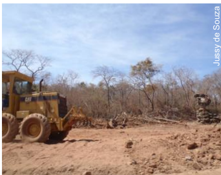
Maquinário pesado abrindo caminho